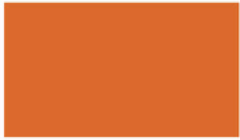
Orange ออเรนจ์ ORJ310 D