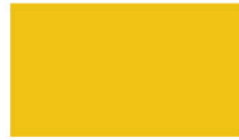
Royal Yellow เหลืองวันพ่อ YLJ210 M