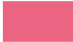
Raspberry ราสเบอร์รี่ PKJ210 M