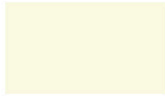
Off White ออฟไวท์ WHJ110 L