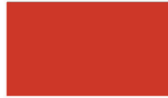
True Red แดงสด RDJ320 D