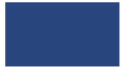
Atlantic แอตแลนติก BLJ250 M