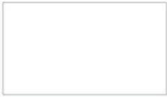
White ขาว WHJ100 W