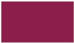
Maroon เลือดหมู RDJ340 D