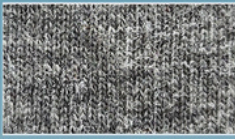
Heather Grey เทาทีอปราย TDJ220 TD