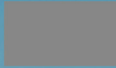
Cement ซีเมนต์ GYJ220 M