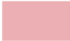
Baby Pink ชมพูอ่อน PKJ110 L