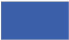
Pacific แปซิฟิก BLJ310 D