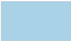
Aqua ฟ้ายอ่อน BLJ115 L