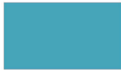
Scuba Blue น้ำทะเล BLJ220 M