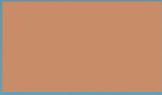
Ice Tea ชาเย็น BRJ220 M