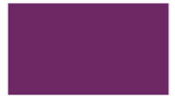
Grape องุ่น PLJ310 D